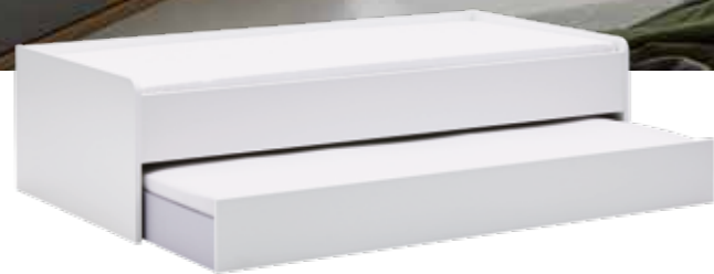
VARIABLE Kastenbett mit einem großen Schubkasten, für einen zweiten Schlafplatz (90 x 190 cm) oder als geräumiger Stauraum nutzbar.

Bei mir 'ne ganze Menge, denn ich hab' mega Platz für alles.