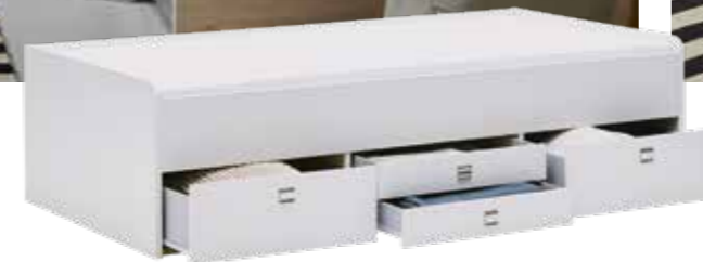
AUFGERÄUMTES KOJENBETT Mit zwei großen und zwei kleinen Kästen