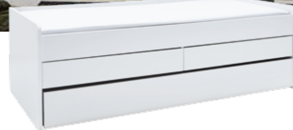
ÜBERNACHTUNGSBESUCH? KEIN PROBLEM Ausgesprochen bequem und dennoch auf alles vorbereitet mit zusätzlicher Liegefläche für den Besuch