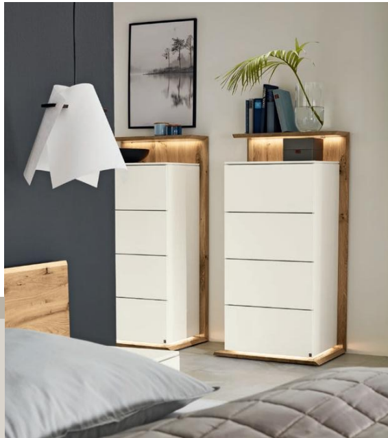
Kommoden (585080), Lack weiß, Absetzung Wildeiche massiv, mit vier Schubkästen, Panelsockel in Absetzung, ca. B 70, H 140, T 54 cm