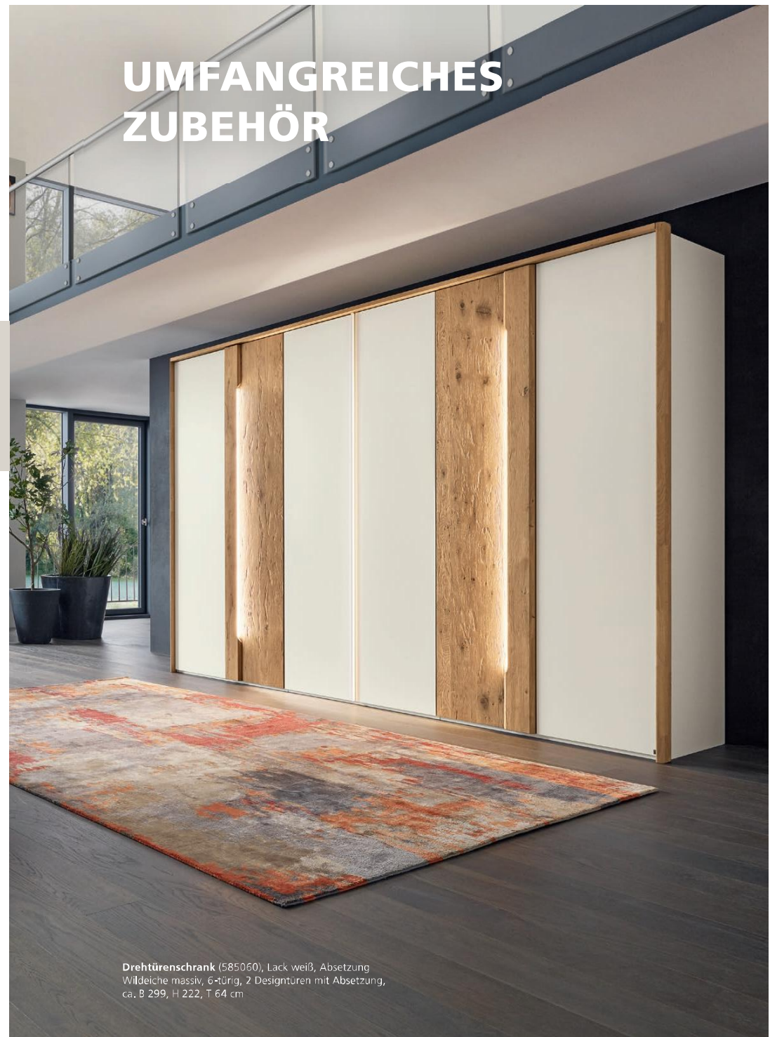
Drehtüreschrank (585060), Lack weiß, Absetzung Wildeiche massiv, 6-türig, 2 Designtüren mit Absetzung, ca. B 299, H 222, T 64 cm