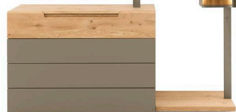
Kommode mit Anstell-Garderobe