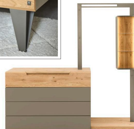
Kommode mit Anstell-Garderobe