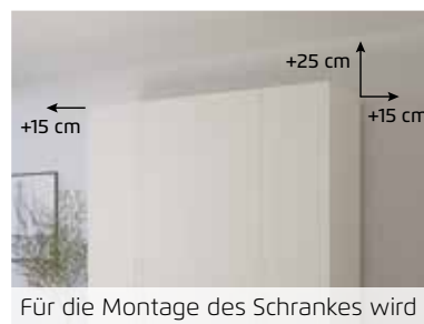
Für die Montage des Schrankes wird folgender Platz benötigt: Schrankhöhe + mind. 25 cm, Schrankbreite + mind. je 15 cm an beiden Seiten.