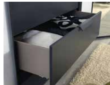
Schubkästen mit Unterflurschiene, Selbsteinzug und Dämpfung.